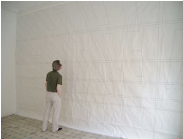
Untitled (set), 2005, impression jet d'encre, 483 x 345 cm vues de l'exposition Mirror Ball , Oberwelt, Stuttgart